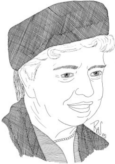
ئىليانور رۇسە قىلت